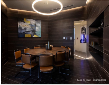
Salón de juntas - Business room