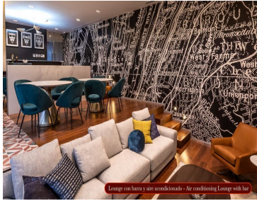
Lounge con barra y aire acondicionado - Air conditioning Lounge with bar