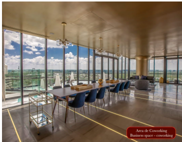
Área de coworking Business space - coworking