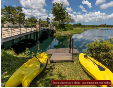
Entrada al lago desde tu edificación - Lake entrance from your building