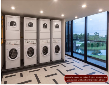
Área de lavandería con ventanas de piso a techo y terraza Laundry room with floor-to-ceiling window & terrace