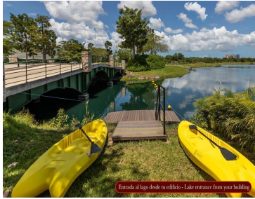
Entrada al lago desde tu edificación - Lake entrance from your building