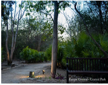
Parque Central - Central Park