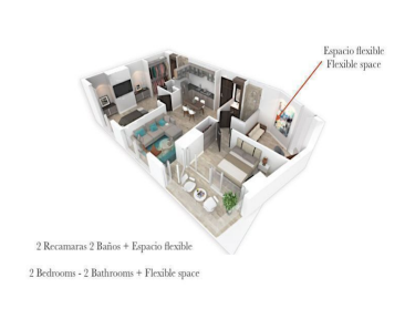
2 Recamaras 2 Baños + Espacio flexible 2 Bedrooms - 2 Bathrooms + Flexible space