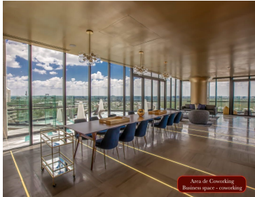
Área de coworking Business space - coworking