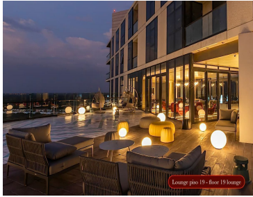
Lounge piso 19 - floor 19 lounge