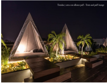
Tiranda y área con sillones puff - Tiram and puff lounge