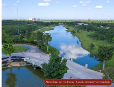
Alrededores del residencial - Gated community surroundings