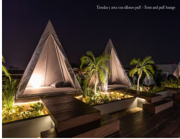
Tiranda y área con sillones puff - Tiram and puff lounge