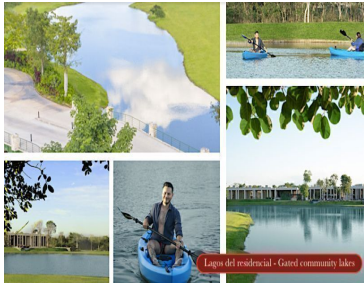
Lagos del residencial - Gated community lakes