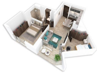
2 Recamaras 1 Baño 2 Bedrooms 1 Bathroom