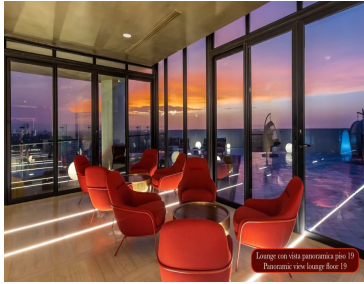
Lounge con vista panorámica piso 19 Panoramic view lounge floor 19