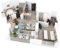
2 Recamaras 2 Baños 2 Bedroom 2 Bathrooms