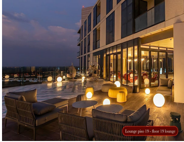
Lounge piso 19 - floor 19 lounge