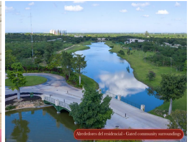
Alrededores del residencial - Gated community surroundings