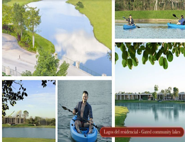
Lagos del residencial - Gated community lakes