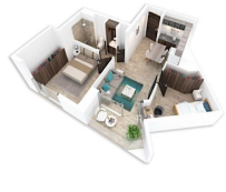
2 Recamaras 1 Baño 2 Bedrooms 1 Bathroom