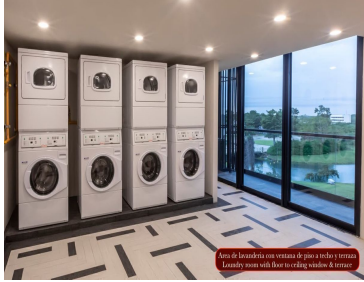
Área de lavandería con ventanas de piso a techo y terraza Laundry room with floor-to-ceiling windows & terrace