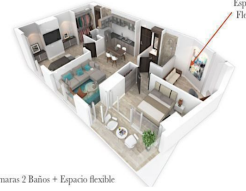
Espacio flexible Flexible space