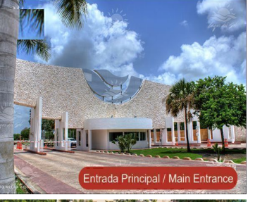
Entrada Principal / Main Entrance