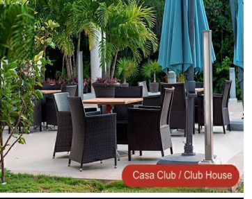
Casa Club / Club House