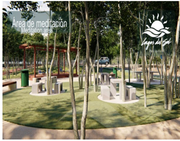
Área de meditación Meditation area