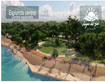
Explanada central Central esplanade