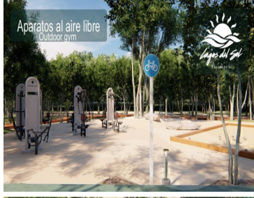
Aparatos al aire libre Outdoor gym