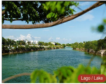
Lago / Lake