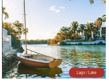
Lago / Lake