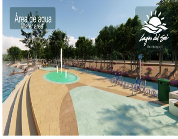
Área de agua Water area