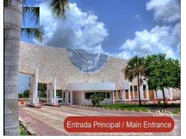
Entrada Principal / Main Entrance