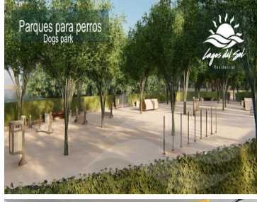
Parques para perros Dogs park