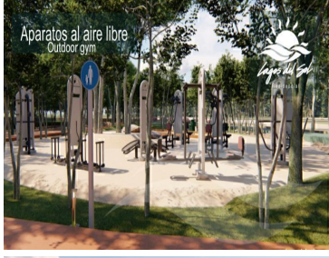
Aparatos al aire libre Outdoor gym