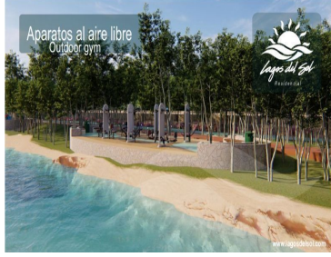
Aparatos al aire libre Outdoor gym