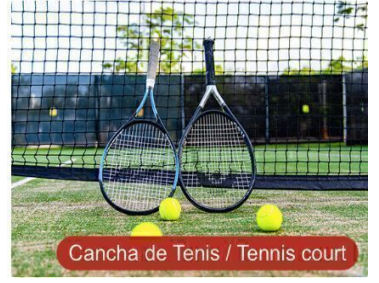
Cancha de Tenis / Tennis court