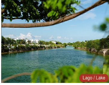
Lago / Lake