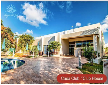
Casa Club / Club House