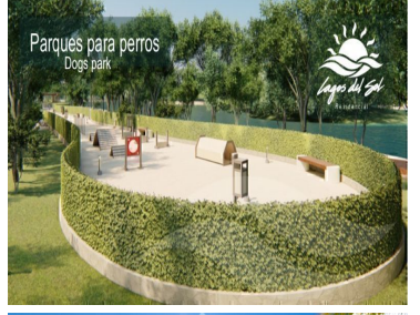
Parques para perros Dogs park