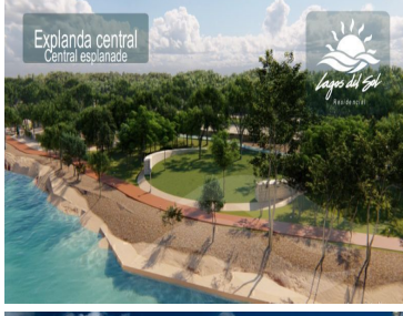
Explanada central Central esplanade