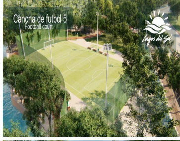
Cancha de futbol 5 Football court