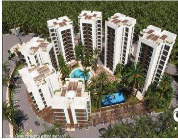
Vista aérea y alrededores