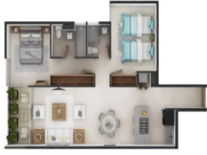
Departamento 2 recamaras con terraza 2 Bedroom condo with terrace