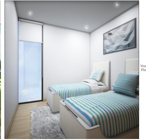
Ventanas de piso a techo Floor to ceiling windows