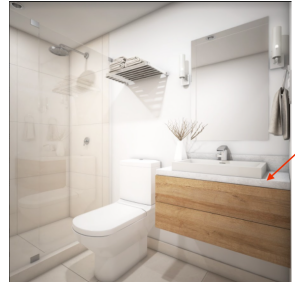
Baño con meseta de mármol Bathroom with marble countertop