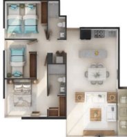
Departamento 3 recamaras con terraza 3 Bedroom condo with terrace