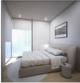
Recamara principal Main room