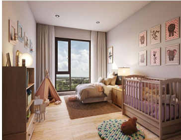
Amplias terrazas Vista al campo de golf Wide terraces Golf Course view