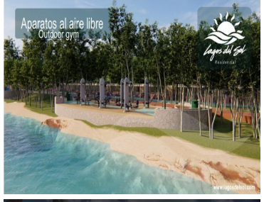
Aparatos al aire libre Outdoor gym