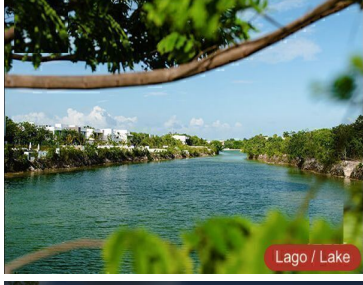
Lago / Lake