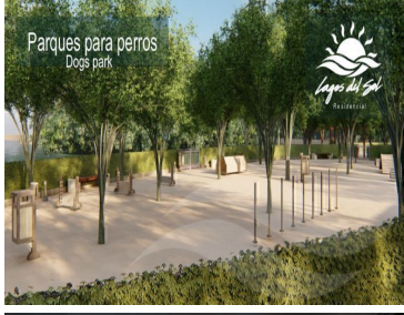
Parques para perros Dogs park