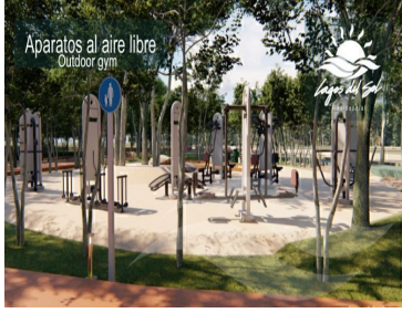
Aparatos al aire libre Outdoor gym