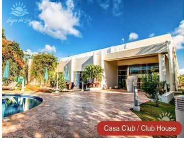
Casa Club / Club House