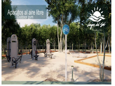
Aparatos al aire libre Outdoor gym