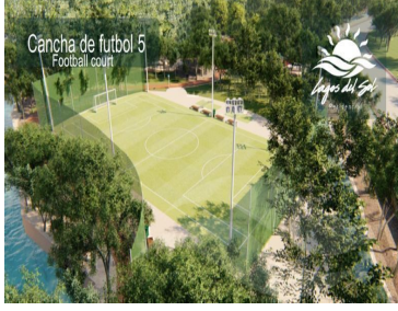
Cancha de fútbol 5 Football court