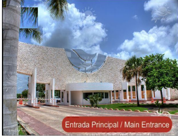
Entrada Principal / Main Entrance