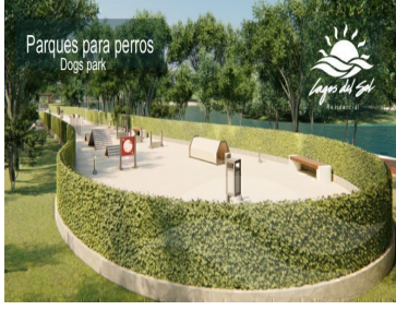
Parques para perros Dogs park