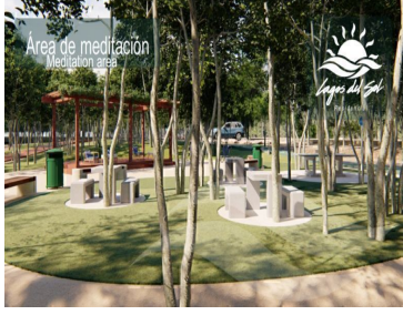
Área de meditación Meditation area