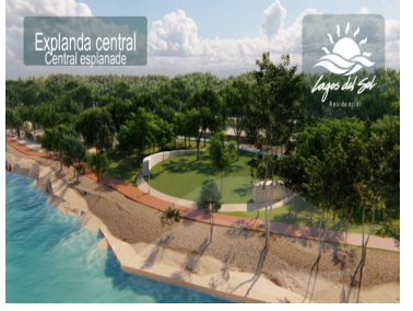
Explanada central Central esplanade