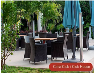
Casa Club / Club House