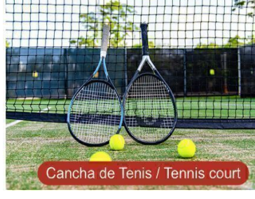
Cancha de Tenis / Tennis court