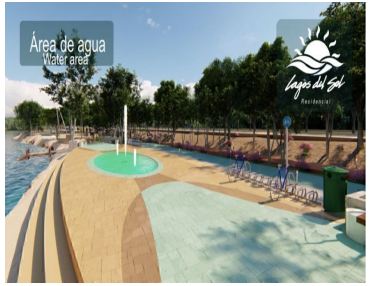
Área de agua Water area