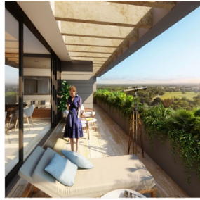
Amplias terrazas Vista al campo de golf Wide terraces Golf Course view