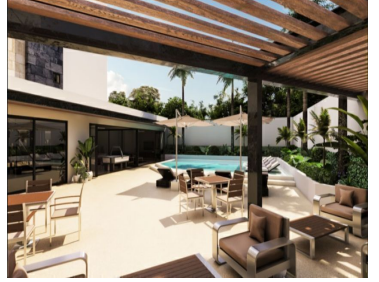
Terraza - Penthouse - Terrace