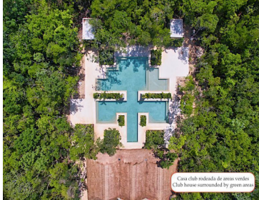
Casa club rodeada de áreas verdes Club house surrounded by green areas