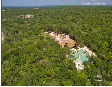
Mar Caribe - Caribbean sea