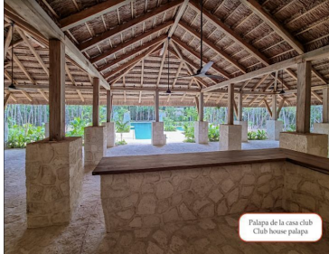
Palapa de la casa club Club house palapa