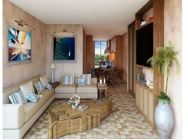
Casa club Club house