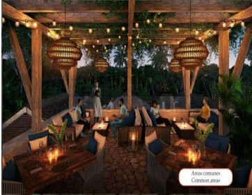
Áreas comunes Common areas