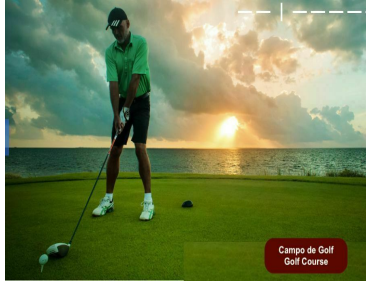
Campos de Golf Golf Course