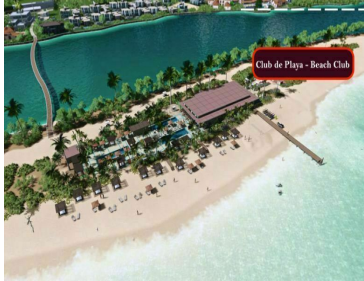
Club de Playa - Beach Club