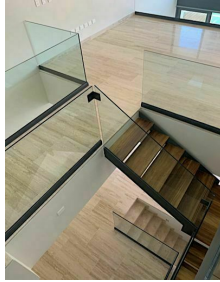
barandales de vidrio templado Tempered glass riats