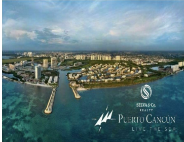
SEVIA & Co. REALTY PUERTO CANCUN LIVE THE SEA