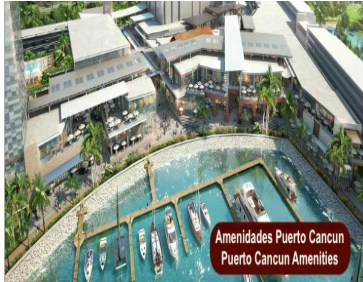
Amenidades Puerto Cancun Puerto Cancun Amenities