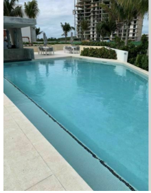
Family pool Alberca familiar