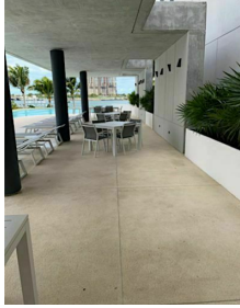
Areas comunes vista al agua Common areas water view