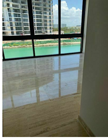
Vista al agua Water view