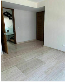
Piso de marmol Marble floor