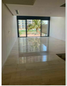
Recamara principal vista al canal Main bedroom canal view