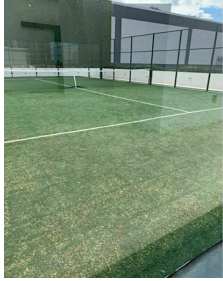
Pista de paddle Paddle court