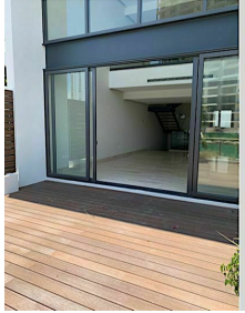
Sala doble altura ventana de pared completa Double high living room Full wall window