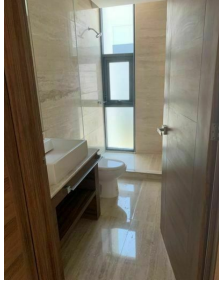
Baño cubierto en marmol Marble in bathroom walls