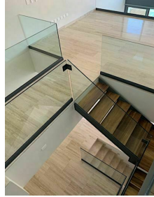
barandales de vidrio templado Tempered glass riats