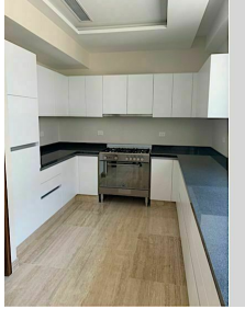
Cocina integral Built in kitchen