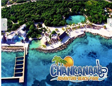
Vista - View