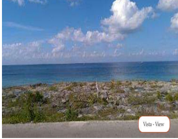
Vista - View