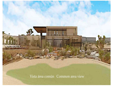
Vista area común Common area view