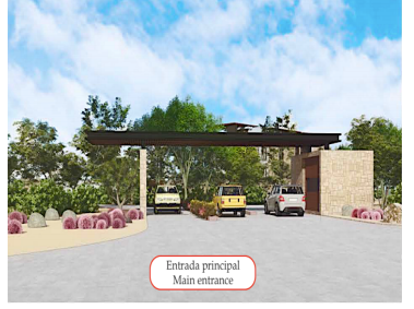
Entrada principal Main entrance