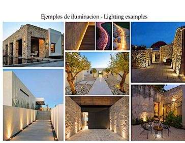
Ejemplos de iluminacion - Lighting examples