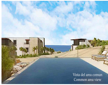
Vista del area comun Common area view