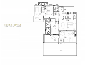
CONDominio 3 RECAMARAS 3 BEDROOM CONDOMINIUM