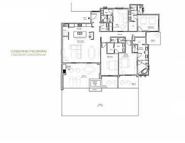
CONDominio 4 RECAMARAS 4 BEDROOM CONDOMINIUM