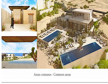
Areas comunes - Common areas