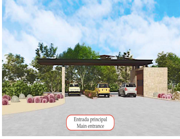
Entrada principal Main entrance