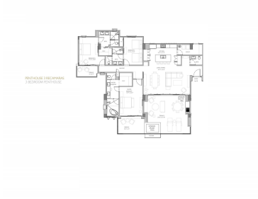
CONDOPINHO 2 RECAMARAS 2 BEDROOM CONDOMINIUM