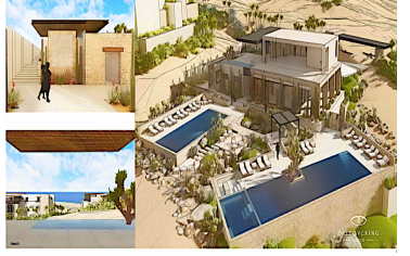
Areas comunes - Common areas