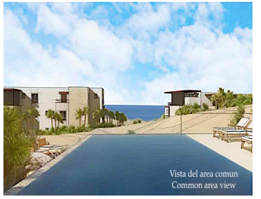
Vista del area comun Common area view