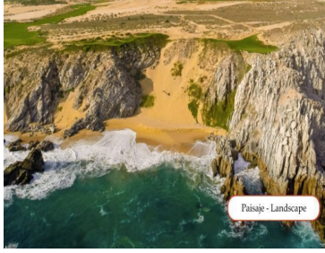
Paisaje - Landscape