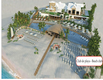
Club de playa - Beach club