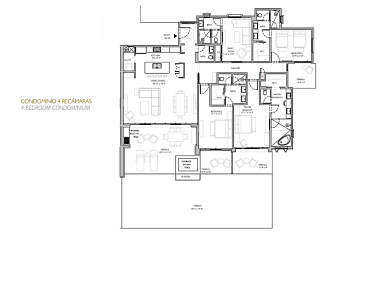
CONDOPINHO 4 RECAMARAS 4 BEDROOM CONDOMINIUM