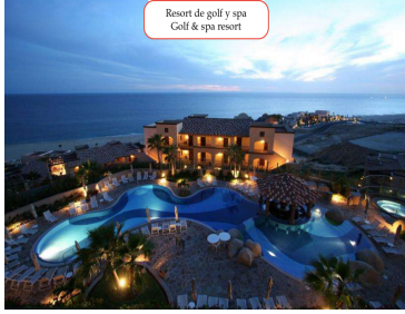
Resort de golf y spa Golf & spa resort