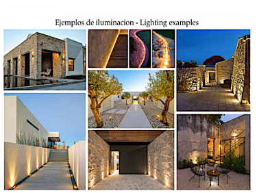
Ejemplos de iluminacion - Lighting examples