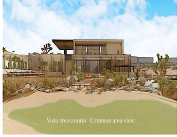
Vista área común - Common area view