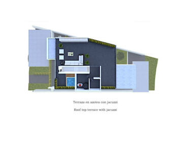
Terraza en azotea con jacuzzi Roof top terrace with jacuzzi