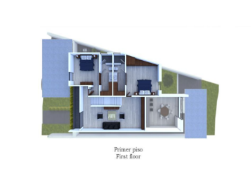
Primer piso First floor