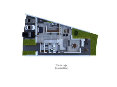
Planta baja Ground floor