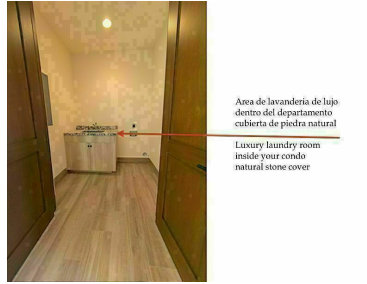
Área de lavandería de lujo dentro del departamento cubierta de piedra natural. Luxury laundry room inside your condo natural stone cover