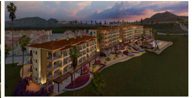
Vistas a la montaña Mountain views