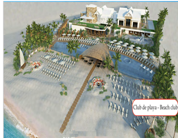
Club de playa - Beach club