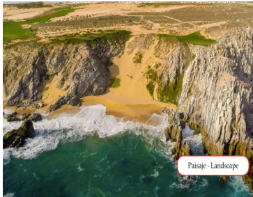
Paisaje - Landscape