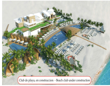
Club de playa, en construcción - Beach club under construction