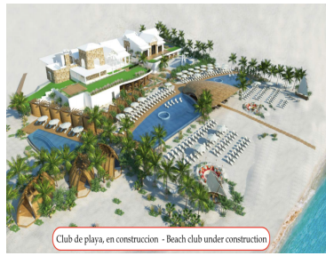
Club de playa, en construcción - Beach club under construction