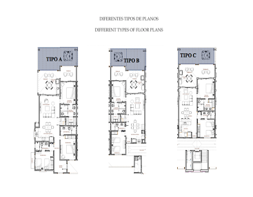
DIFERENTES TIPOS DE PLANOS DIFFERENT TYPES OF FLOOR PLANS