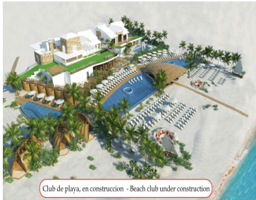
Club de playa, en construcción - Beach club under construction