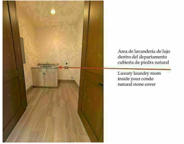
Area de lavandería de lujo dentro del departamento cubierta de piedra natural Luxury laundry room inside your condo natural stone cover