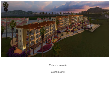
Vistas a la montaña Mountain views