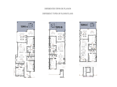
DIFERENTES TIPOS DE PLANOS DIFFERENT TYPES OF FLOOR PLANS