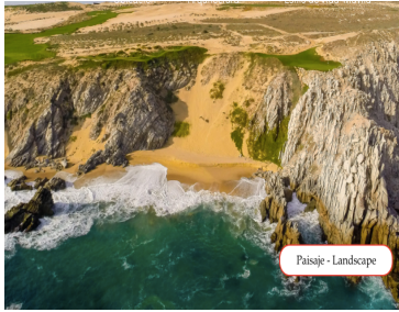
Paisaje - Landscape