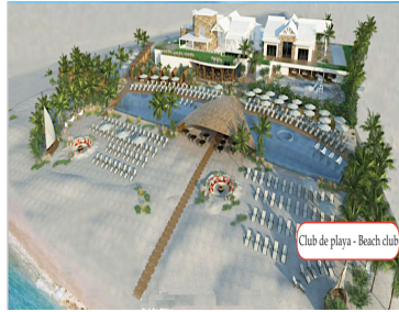
Club de playa - Beach club