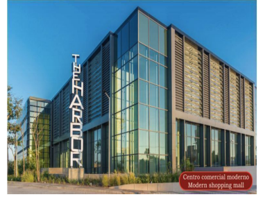
Centro comercial moderno Modern shopping mall