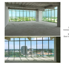
Fotos reales Ventanas de piso a techo Real pictures Floor to ceiling windows