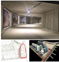
Túnel subterráneo Underground tunnel