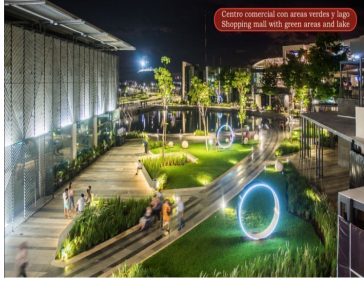
Centro comercial con áreas verdes y lago Shopping mall with green areas and lake