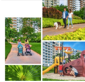
Áreas verdes Green areas