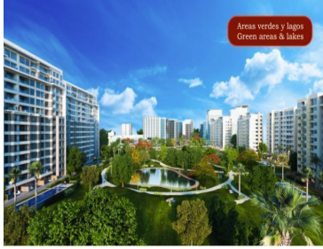
Áreas verdes y lagos Green areas & lakes