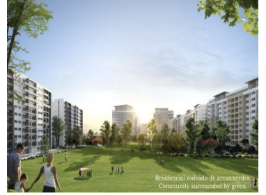
Residencial rodeado de áreas verdes Community surrounded by green