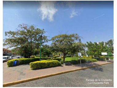
Parque de la Cruccecita La Cruccecita Park