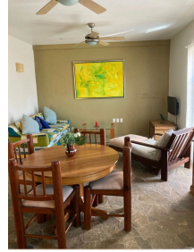
Sala Living room