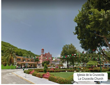
Iglesia de la Cruccecita La Cruccecita Church