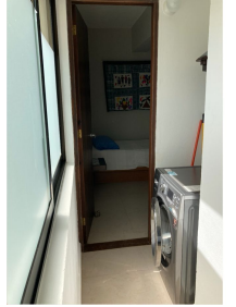
Area de lavandería Laundry area