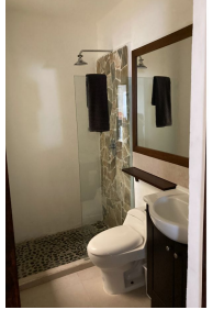
Acabados de los baños Bathroom finishes