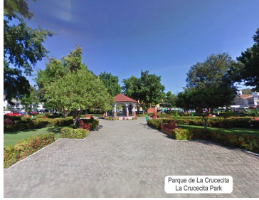
Parque de La Cruccecita La Cruccecita Park