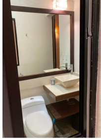
Acabados de baño Bathroom finishes