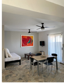
Sala-comedor Living room - dining room