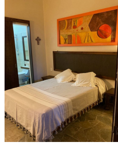
Recamara principal con baño ensuite Main bedroom with ensuite bathroom