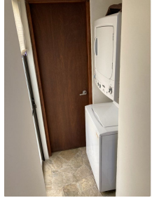
Area de lavado Laundry area