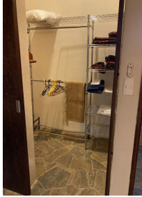
Closet vestidor Walk in closet