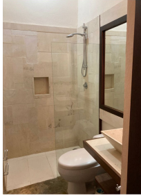
Acabados de los baños Bathroom finishes