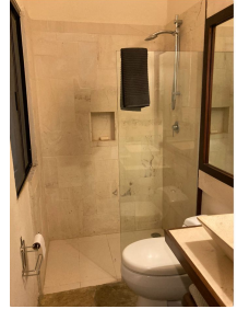
Acabados en baños Bathroom finishes