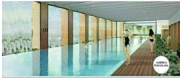
Alberca techada vista panorámica Roofted pool panoramic view