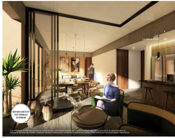
ESPACIOSO Y COMODOS EN TODAS LAS ETAPAS