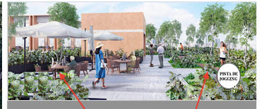
Áreas de descanso en exterior Outdoor lounge areas