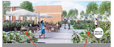
Áreas de descanso en exterior Outdoor lounge areas