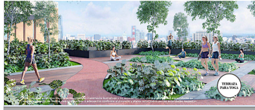
Terraza para yoga a 30 metros de altura Yoga terrace 30 meters high