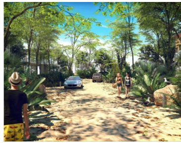
CONCEPTUALIZACIÓN AREA COMERCIAL