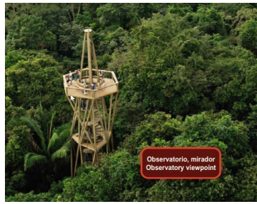
Observatorio, mirador Observatory viewpoint