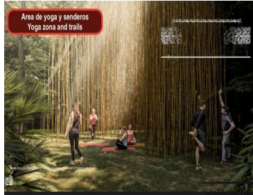
Area de yoga y senderos Yoga zona and trails