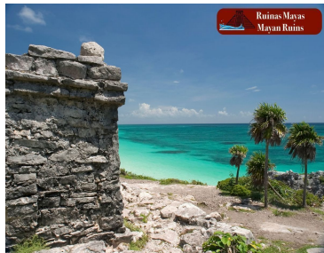
Ruinas Mayas Mayan Ruins