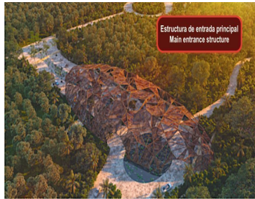
Estructura de entrada principal Main entrance structure