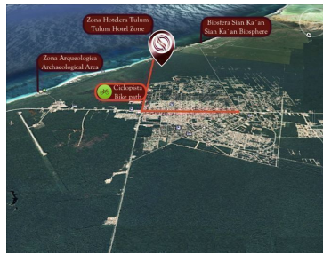
Zona Anapaobica Archaeological Area