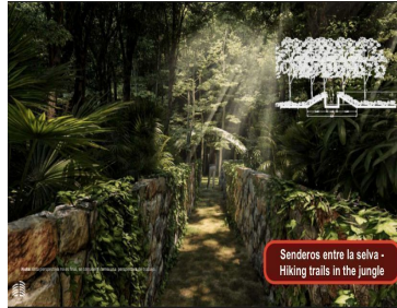
Senderos entre la selva - Hiking trails in the jungle