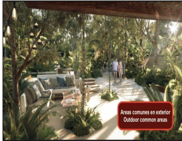
Areas comunes en exterior Outdoor common areas