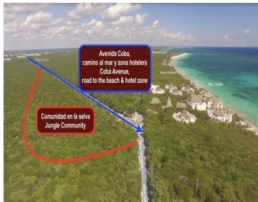
Avenida Coba, camino al mar y zona hotelera Coba's Avenue, road to the beach & hotel zone