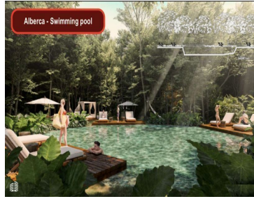
Alberca - Swimming pool