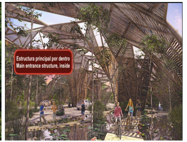
Estructura principal por dentro Main entrance structure, inside