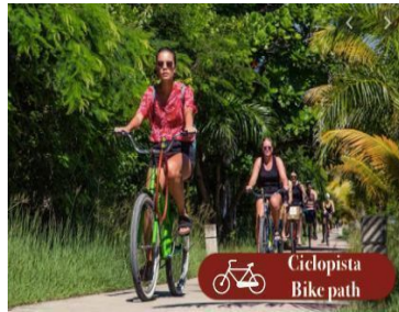
Ciclopista Bike path