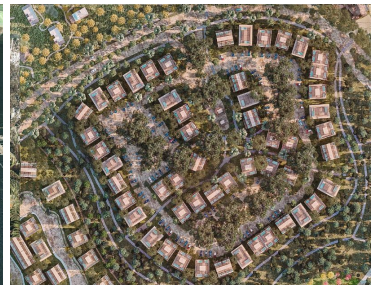
Biosfera Sian Ka'an Sian Ka'an Biosphere