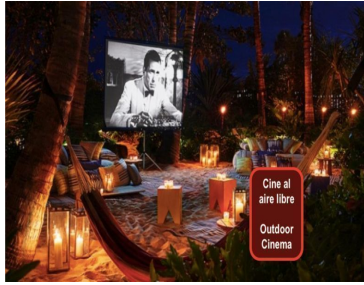
Cine al aire libre Outdoor Cinema