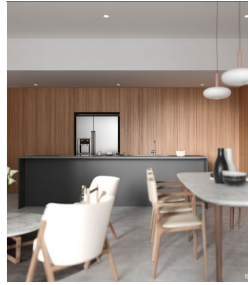
Cocina con diseño abierto Open design kitchen