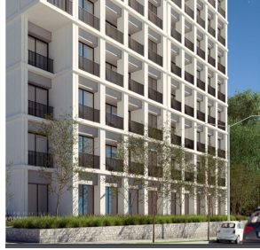
Departamento Pre-construcción Providencia Pre-construction Condo for sale Providencia