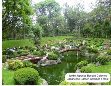
Jardin Japonés Bosque Colomos Japanese Garden Colomos Forest