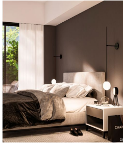
Recamaras Ventanas de piso a techo Bedrooms Floor to ceiling windows