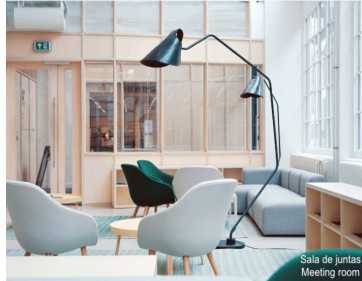
Sala de juntas Meeting room