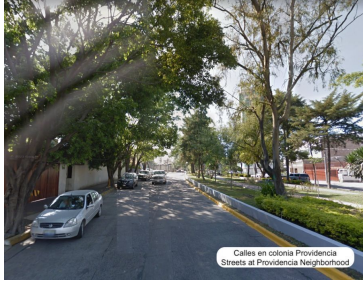
Calles en colonia Providencia Streets at Providencia Neighborhood