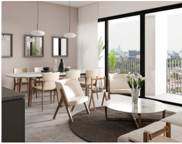
Lounge con television Lounge with television