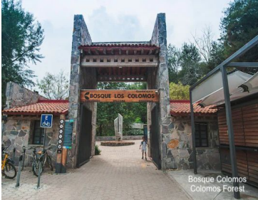
Bosque Colomos Colomos Forest