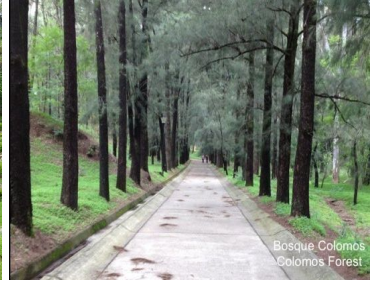
Bosque Colomos Colomos Forest