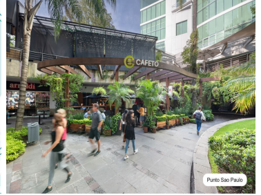
Punto Sao Paulo