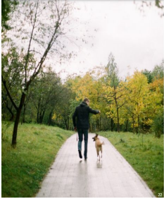
Parques cercanos Near by parks