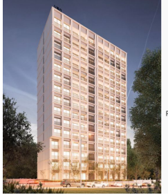
Pre-construcción Colonia Providencia Guadalajara Pre-construction Providencia neighborhood Guadalajara