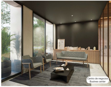
Centro de negocios Business center