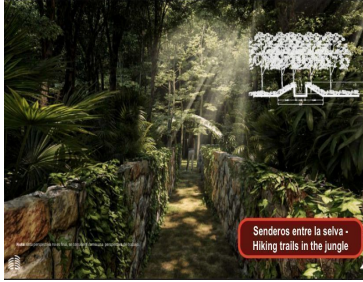
Senderos entre la selva - Hiking trails in the jungle