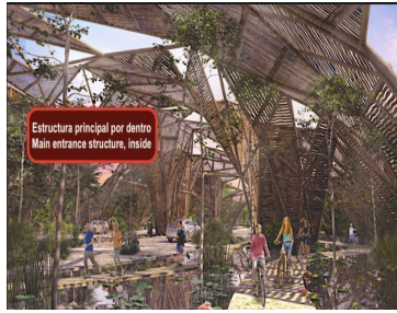
Estructura principal por dentro Main entrance structure, inside