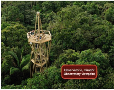
Observatorio, mirador Observatory viewpoint