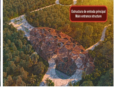
Estructura de entrada principal Main entrance structure