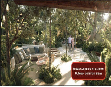
Areas comunes en exterior Outdoor common areas