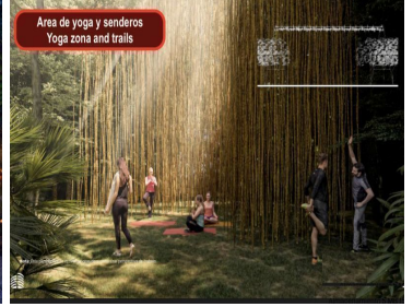
Area de yoga y senderos Yoga zona and trails