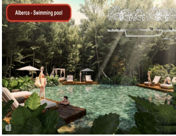
Alberca - Swimming pool