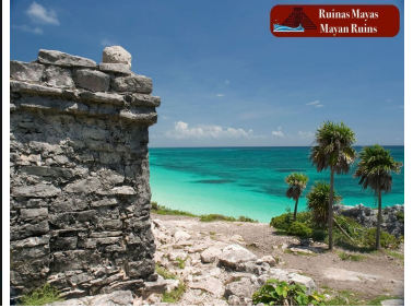
Ruinias Mayas Mayan Ruins