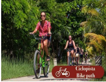
Ciclopista Bike path