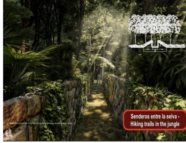
Senderos entre la selva - Hiking trails in the jungle