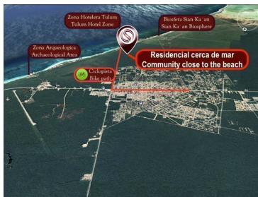
Residencial cerca de mar Community close to the beach