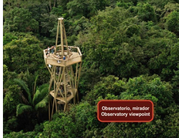
Observatorio, mirador Observatory viewpoint