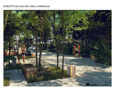
CONCEPTUALIZACION AREA COMERCIAL