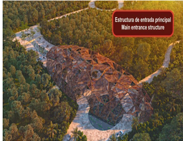
Estructura de entrada principal Main entrance structure