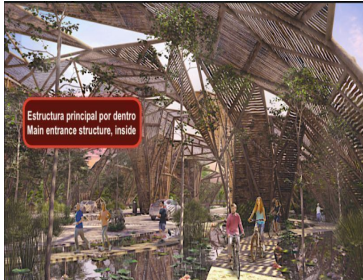
Estructura principal por dentro Main entrance structure, inside