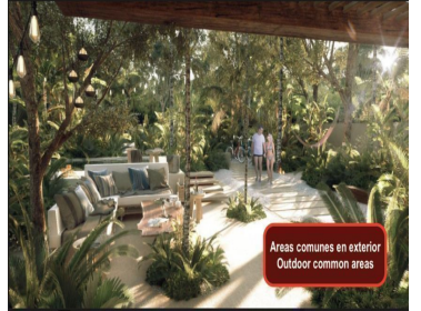
Areas comunes en exterior Outdoor common areas