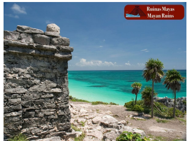
Restos Mayas Mayan Ruins