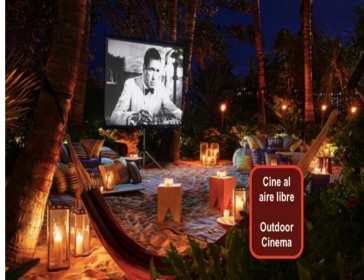
Cine al aire libre Outdoor Cinema