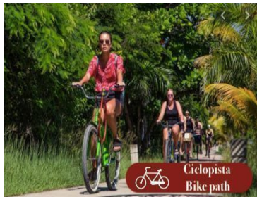
Ciclista Bike path