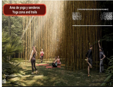
Area de yoga y senderos Yoga zona and trails