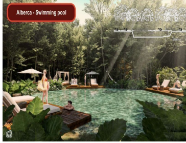
Alberca - Swimming pool