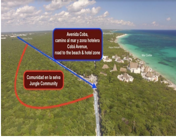
Avenida Coba, camino al mar y zona hotelera Cobá Avenue, road to the beach & hotel zone