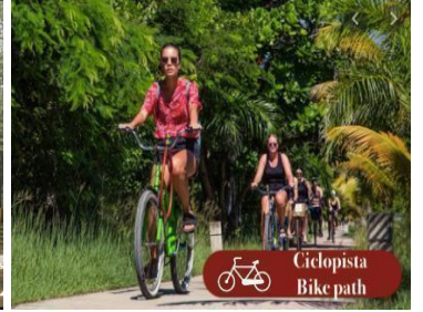
Ciclopista Bike path