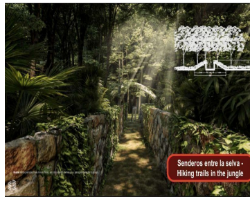
Senderos entre la selva - Hiking trails in the jungle