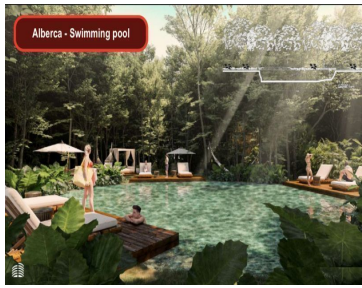
Alberca - Swimming pool