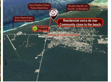
Residencial cerca de mar Community close to the beach