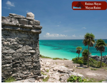
Ruinas Mayas Mayan Ruins