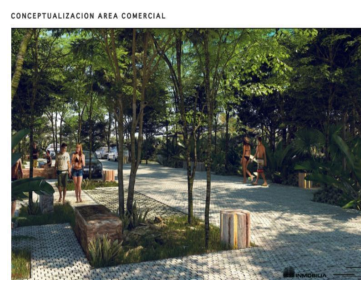
CONCEPTUALIZACION AREA COMERCIAL