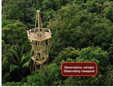
Observatorio, mirador Observatory viewpoint