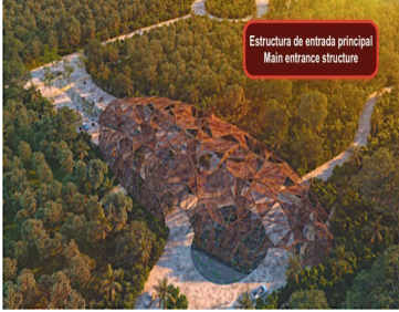
Estructura de entrada principal Main entrance structure