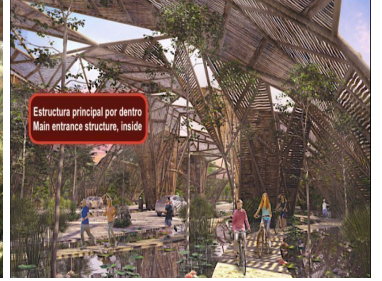
Estructura principal por dentro Main entrance structure, inside