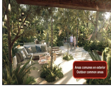
Áreas comunes en exterior Outdoor common areas