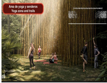
Área de yoga y senderos Yoga zone and trails