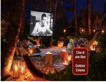
Cine al aire libre Outdoor Cinema