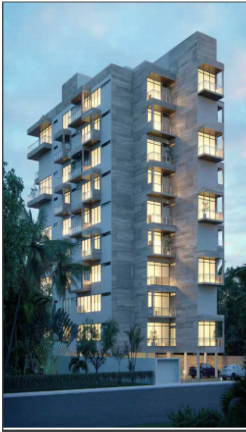
Edificio frente al mar Beachfront building