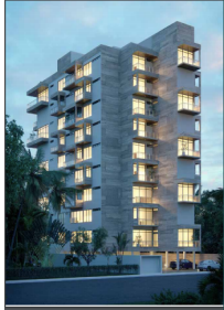
Edificio frente al mar Beachfront building