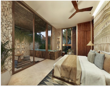
CONDO WITH TERRACE