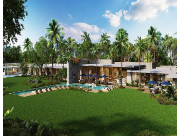
Casa Club - Club House