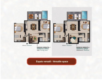
Espacio versátil - Versatile space