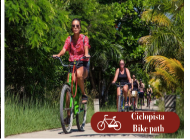
Ciclista Bike path