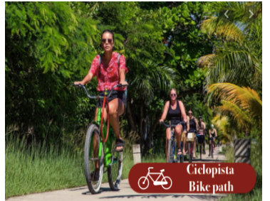
Ciclista Bike path