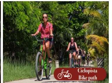
Ciclista Bike path