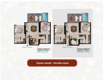
Espacio versátil - Versatile space