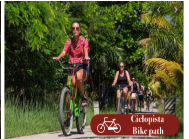
Ciclista Bike path