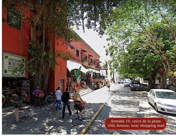
Avenida 10, cerca de la plaza 10th Avenue, near shopping mall