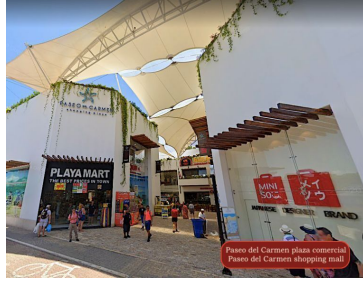
Paseo del Carmen plaza comercial Paseo del Carmen shopping mall