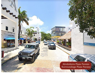
Alrededores Plaza Paraiso Surroundings Plaza Paraiso