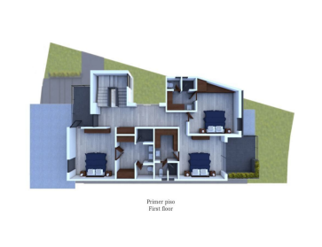
Plano primer First floor