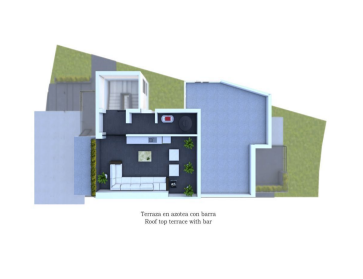
Terraza en azotea con barra Roof top terrace with bar