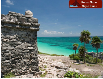
Ruinas Mayas Mayan Ruins