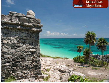
Ruinas Mayas Mayan Ruins