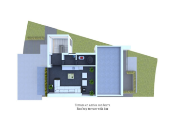
Terrace on rooftop view terrace