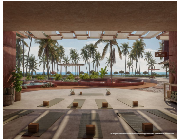
Aerial view Amenities