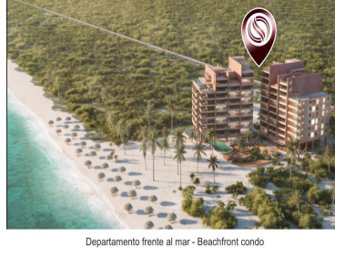
Departamento frente al mar - Beachfront condo