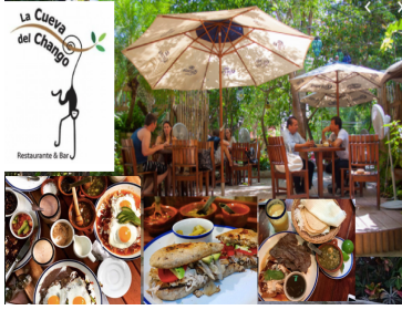
La Cueva del Chango Restaurante & Bar