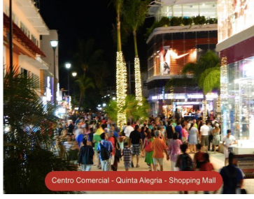
Centro Comercial - Quinta Alegria - Shopping Mall