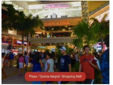
Plaza "Quinta Alegria" Shopping Mall