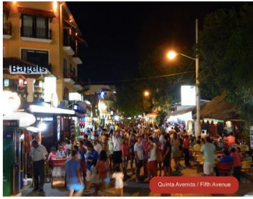
Quinta Avenida / Fifth Avenue