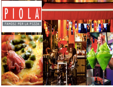
PIOLA FAMOSI PER LA PIZZA