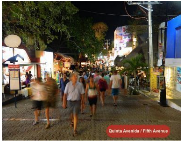
Quinta Avenida / Fifth Avenue