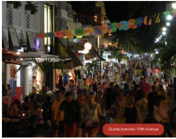
Quinta Avenida / Fifth Avenue