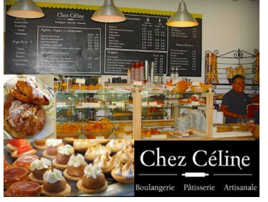
Chez Céline Boulangerie Pâtisserie Artisanale