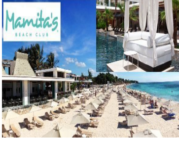
Mamita's BEACH CLUB