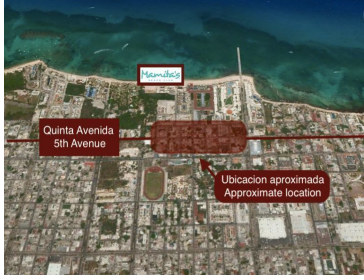
Quinta Avenida 5th Avenue