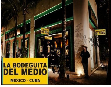
LA BODEGUITA DEL MEDIO MÉXICO - CUBA