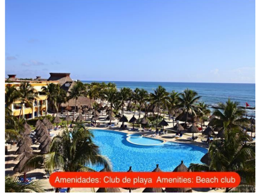
Amenidades: Club de playa Amenities: Beach club