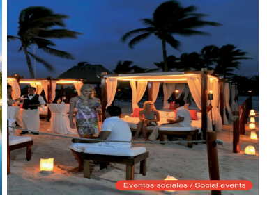
Eventos sociales / Social events