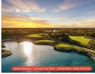
Amenidades: Campo de Golf Amenities: Golf Course