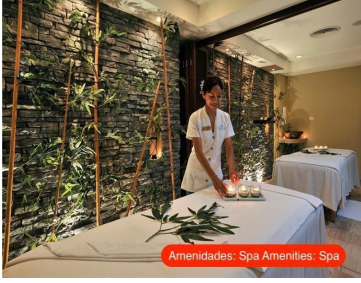
Amenidades: Spa Amenities: Spa