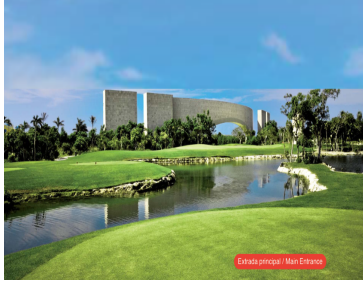
Entrada principal / Main Entrance