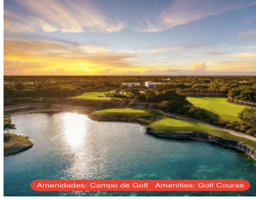
Amenidades: Campo de Golf Amenities: Golf Course