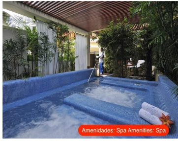
Amenidades: Spa Amenities: Spa