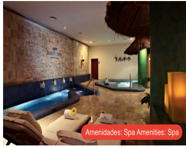
Amenidades: Spa Amenities: Spa