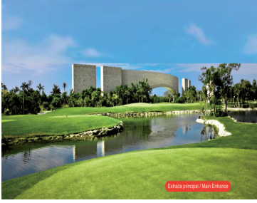
Entrada principal / Main Entrance