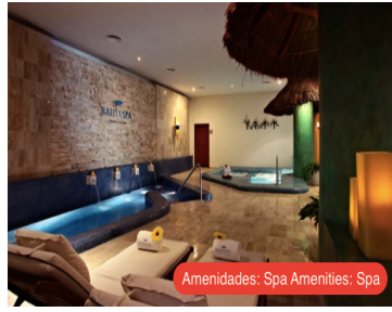
Amenidades: Spa Amenities: Spa