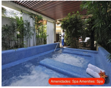
Amenidades: Spa Amenities: Spa