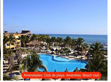
Amenidades: Club de playa Amenities: Beach club