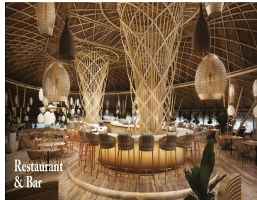
Restaurant & Bar