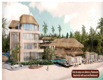
Club de playa con alberca y Restaurant Beachclub with pool and Restaurant