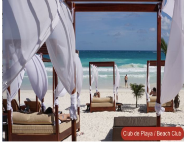
Club de Playa / Beach Club