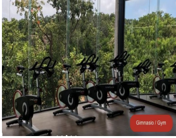
Gimnasio / Gym