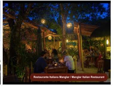
Restaurante Italiano Manglar / Manglar Italian Restaurant