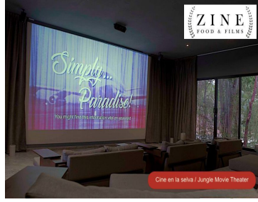
Cine en la selva / Jungle Movie Theater