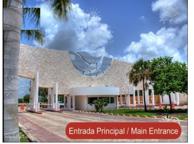
Entrada Principal / Main Entrance