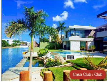
Casa Club / Club