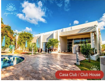
Casa Club / Club House