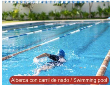
Alberca con carril de nado / Swimming pool