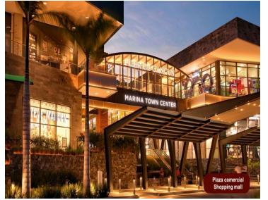
Plaza comercial Shopping mall