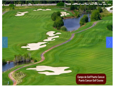
Campo de Golf Puerto Cancun Puerto Cancun Golf Course