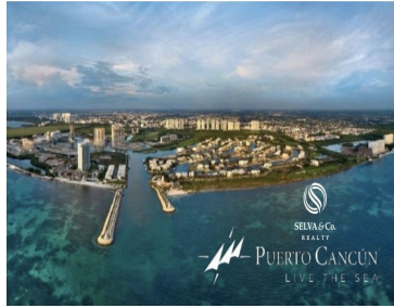
SELVA & Co. REALTY PUERTO CANCÚN LIVE THE SEA