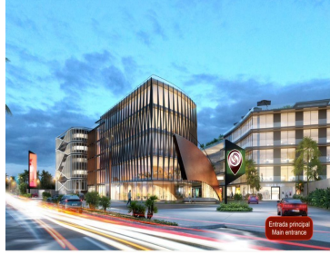
Entrada principal Main entrance