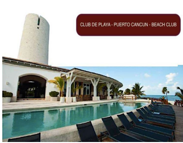
CLUB DE PLAYA - PUERTO CANCUN - BEACH CLUB