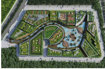
Vista aérea de la comunidad - Aerial view of the community