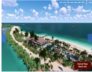
Club de Playa Beach club