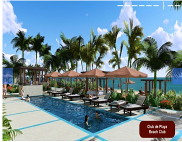
Club de Playa Beach Club