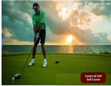
Campo de Golf Golf Course