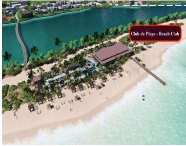
Club de Playa - Beach Club