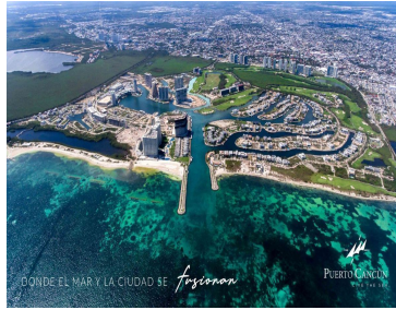
¡DONDE EL MAR Y LA CIUDAD SE fusionan!