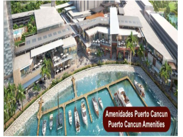
Amenidades Puerto Cancun Puerto Cancun Amenities