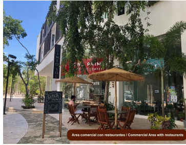
Area comercial con restaurantes / Commercial Area with restaurants