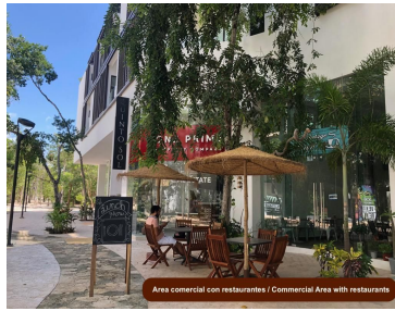
Area comercial con restaurantes / Commercial Area with restaurants