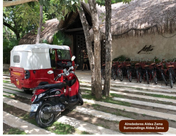
Alrededores Aldea Zama Surroundings Aldea Zama