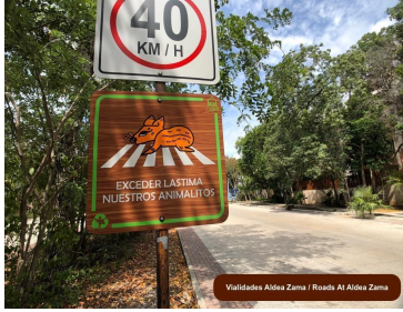
Validades Aldea Zama / Roads At Aldea Zama