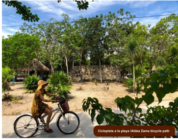
Ciclistas a la playa / Aldea Zama bicycle path