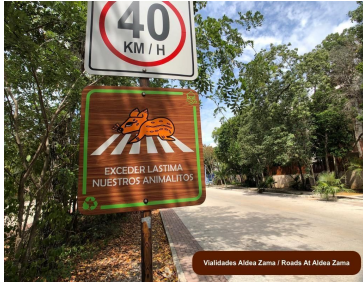
Validades Aldea Zama / Roads At Aldea Zama