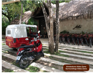
Alrededores Aldea Zama Surroundings Aldea Zama